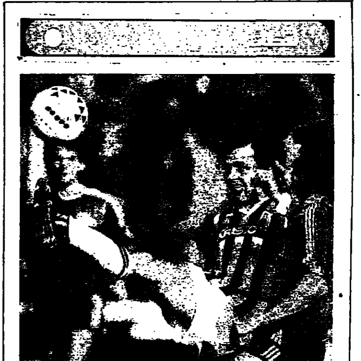
مشال بلاتيني كلبن منتخب فرنسا وصانع العالبي فريق جوفنتوس الايطالي في احدث لحظة كروية